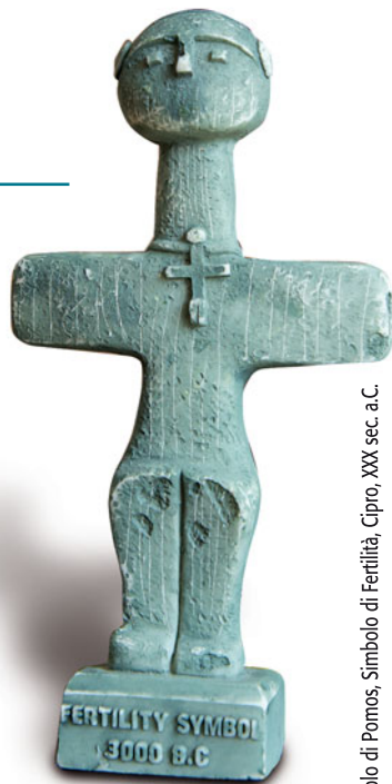
Idolo di Potos, Simbolo di Fertilità, Cipro, XXX sec. a.C.